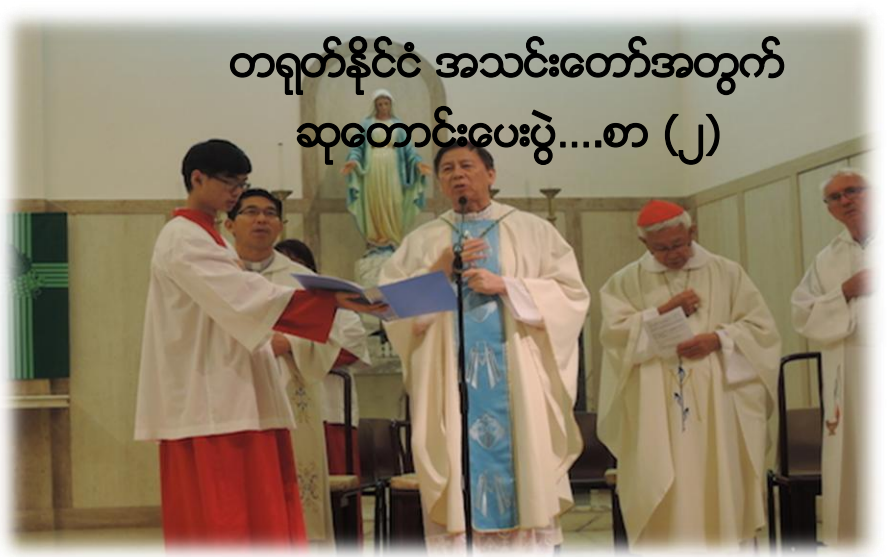
တရုတ်နိုင်ငံ အသင်းတော်အတွက် ဆုတောင်းပေးပွဲ....စာ (၂)