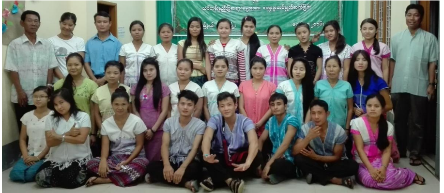
များကလေးဖွံ့ဖြိုးမှုများ၊ ကလေးများသင်ယူမှုပုံစံအမျိုးမျိုး၊ ထိရောက်တက်ကြွသော သင်ယူမှုနည်းလမ်းများနှင့်သင်ထောက်ကူများပြုလုပ်ဖန်တီးခြင်းစသည်တို့ဖြစ်ပါသည်။