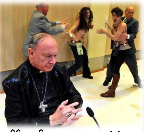
လိင်တူချစ်သူများအား..စာ...(၄)