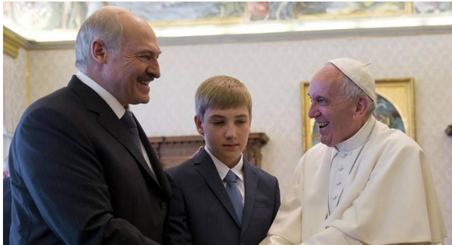
လျက်ရှိကြောင်းဗာတီကန်ရုံးချုပ်ထုတ်ပြန်ချက်တွင်တွေ့ရှိရသည်။ ၎င်းတွေ့ဆုံပွဲတွင် မြို့တော်၌၎င်း၊ နယ်အသီးသီး၌၎င်း ငြိမ်းချမ်းရေးအတွက်ရည်ရွယ်ပြီး အသားပေးပြောဆိုထားသည်ကို တွေ့ရှိရသည်။ ထို့နောက်သမ္မတ Lukashenko က ရဟန်းမင်းကြီးအား ခရစ္စတူးကားတိုင်တစ်ခု၊ ပန်းချီကားချပ်တစ်ခုနှင့် ခေတ်မှီရထား

ရဟန်းမင်းကြီးအရှင်သူတော်မြတ်သည် Belarus သမ္မတနှင့်တွေ့ဆုံခဲ့သည်။ ၎င်းသမ္မတသည် မကြာသေးမီက ဗာတီကန်၏နိုင်ငံတကာ ဆက်သွယ်ရေးဌာနမှ ဂိုဏ်းချုပ်ဆရာတော်ကြီး ပေါလ်ရီချက်၏အကူအညီဖြင့် ဗာတီကန်၏ကာဒီနယ်ကြီး Pietro Parolin နှင့်လည်း သွားရောက်တွေ့ဆုံခဲ့သည်ဟုလည်းသိရသည်။