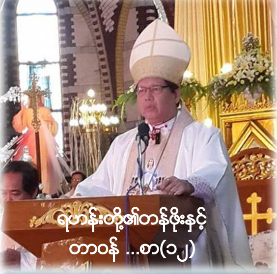
ရဟန်းတို့၏တန်ဖိုးနှင့် တာဝန် ...စာ(၁၂)