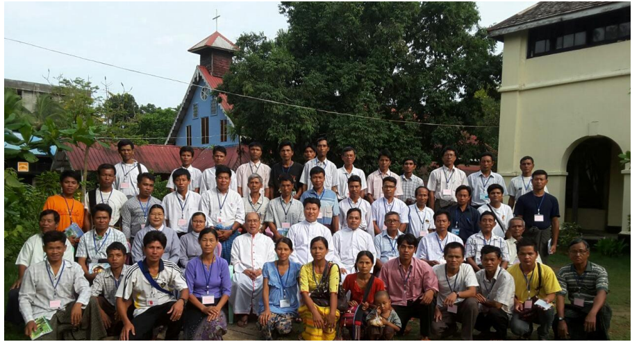
သင်တန်းပေးရခြင်းကို အားရကျေနပ်ပြီး ကျောင်းထိုင်ဘုန်း တော်ကြီးမှာလည်းဧည့်ဝတ် ကျေကြောင်း ပြောသည်။

သင်တန်းကို ဖာသာရ်ဘော်စကို၊ ဖာသာရ်ဒါနီအဲဌေးရီ၊ စစ္စတာရ်အက်စတာ နှင့်စစ္စတာရ်ကက်သရင်း တို့မှပို့ချခဲ့သည်။ သင်တန်းပို့ချပေးသူ ဖာသာရ် ဘော်စကို မှလည်း သင်တန်းပို့ချပေး သည့်နေရာ တွင် "လေမုန်တိုင်းကြောင့်မီး ပျက်ပြီး အခက်အခဲရှိခဲ့တယ်။ အရမ်းပူအိုက်လို့ခွေး ထွက်ပြီးအနေရခက်တယ်"သို့သော်လည်း