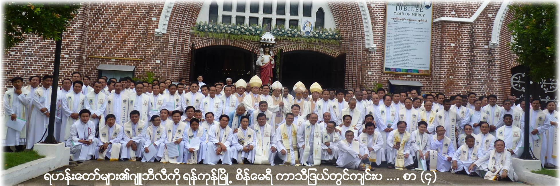
ရဟန်းတော်များ၏ဂျူဘီလီကို ရန်ကုန်မြို့၊ စိန်မေရီ ကာသီဗြယ်တွင်ကျင်းပ .... စာ (၄)