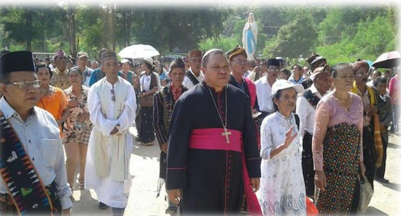
ကမ်းခြေအခြေအနေသစ်ကိုဆန့်ကျင် စာ...(၉)