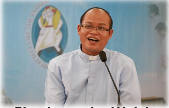
အပြစ်များကိုအထူးအခွင့်လွတ်ပိုင်ခွင့်ရရှိထားသောရဟန်းတော်များ .. စာ...(၁၂)