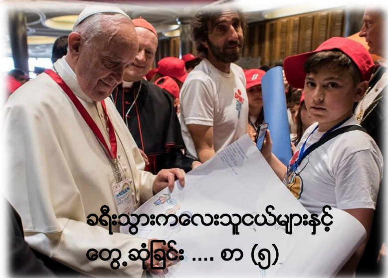
ခရီးသွားကလေးသူငယ်များနှင့် တွေ့ဆုံခြင်း .... စာ (၅)